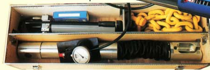
Verktyg för förspänning ▶ av staglinor vid vindkraftbyggen i Danmark.