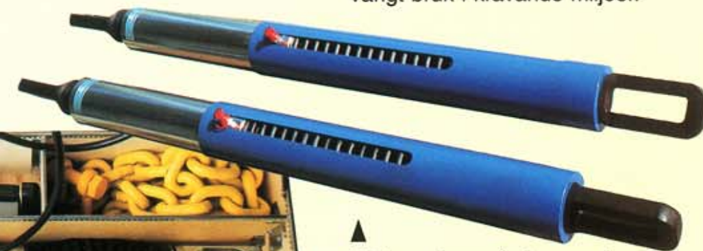
▲ 50 tons dragcylindrar med 415 mm slaglängd för offshoreanläggning i Norge.