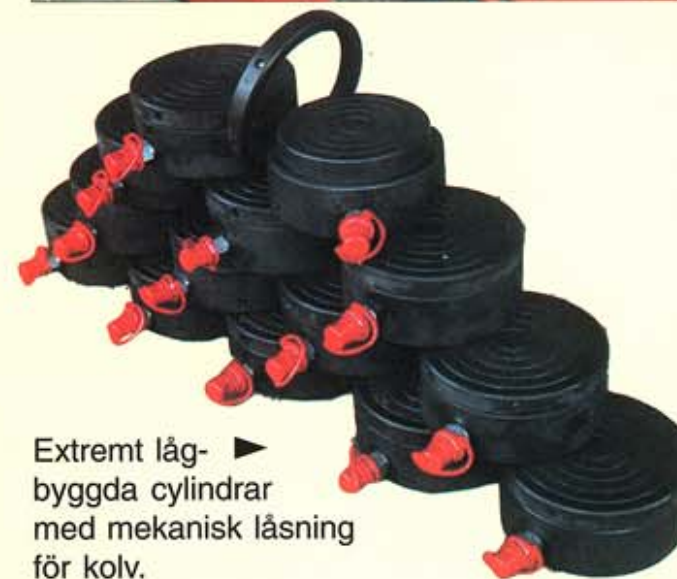
Extremt låg- ▶ byggda cylindrar med mekanisk låsning för kolv.