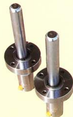
◀ Cylindrar för frigöring av räddningsbåtar.