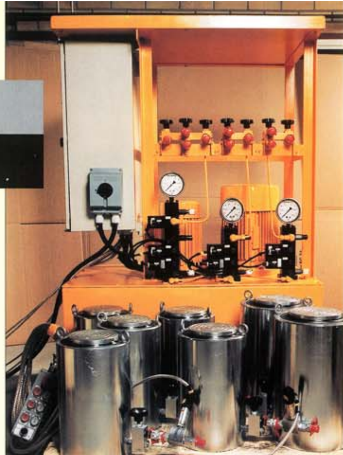
▲ Utrustning för installation av värmeväxlare vid kärnkraftverk i Argentina.

I denna broschyr visas hur vi löst olika arbetsuppgifter. Ibland har kraven varit extrema som exempelvis inom kärnkraft- och offshoreindustrin.