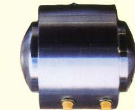
◀ Cylindrar för bromsok på hydrauliskt "lok" vid varv i Rostock.