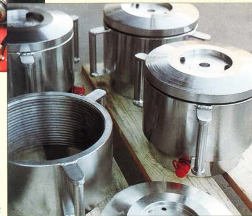
▲ Mekaniska låsningar för 100 tons cylindrar. En konstruktion, som också skyddar cylindern vid långvarigt bruk i krävande miljöer.