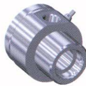
Forgavl m/sylindrisk hals